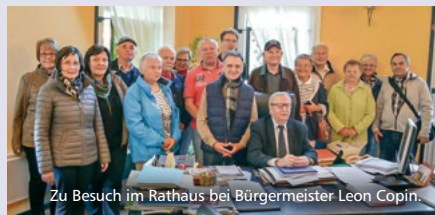
Zu Besuch im Rathaus bei Bürgermeister Leon Copin.

Im Oktober besuchten Mitglieder des Freundeskreises die Waldenburger Partnerstadt Noyelles les Vermelles in Frankreich. Wir wurden sehr herzlich empfangen, im Gästehaus der Stadt untergebracht und gut bewirtet.